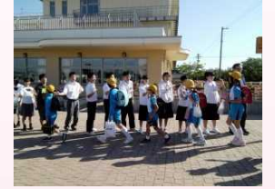
小中高合同あいさつ運動