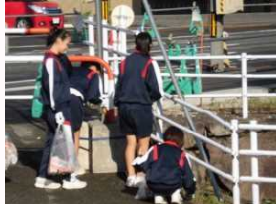
＜清掃ボランティア＞