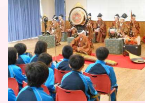
伝統芸能出前講座（雅楽）