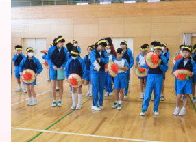
菅笠音頭 踊りの伝承