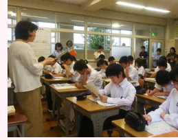
教職員 小・中合同研修会